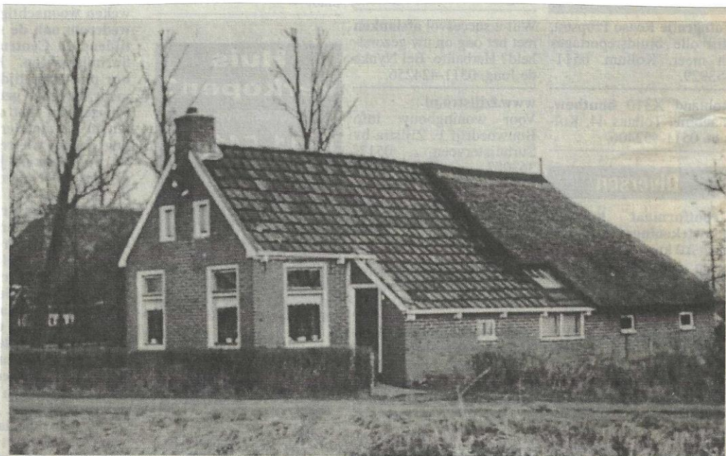
Ald Feart 1 te Surhuizum (H. IJtsma). Afgebrand in januari 1967.