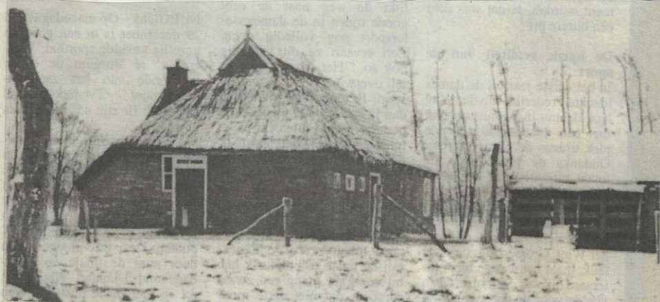
It Langpaed 3 onder Surhuizum in 1965. Laatste bewoner R. Kooistra (nadien afgebroken).