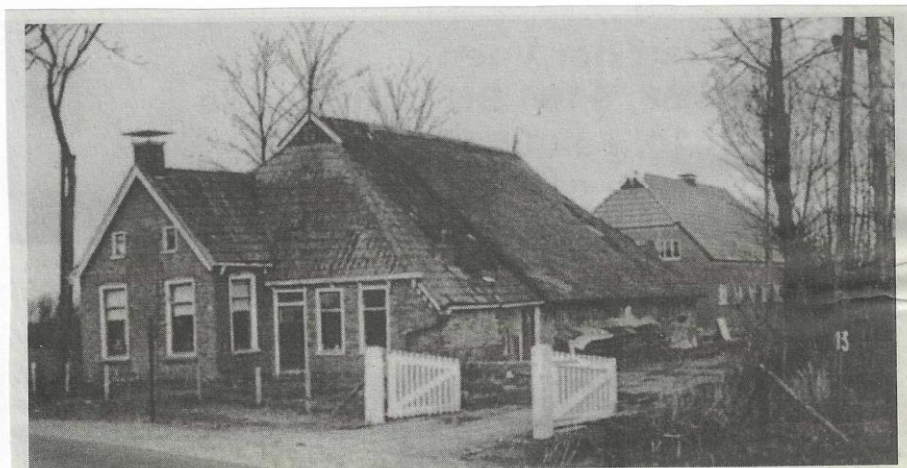
Uterwei 16 te Surhuizum in 1965 (Gebr. IJtsma). Voorhuizinge afgebroken in augustus 1966 in verband met herbouw.