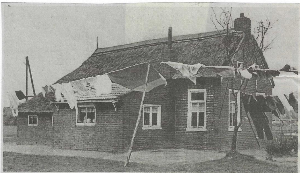
It Langpaed 6 te Surhuizum (D. Jager). Afgebroken in 1966.