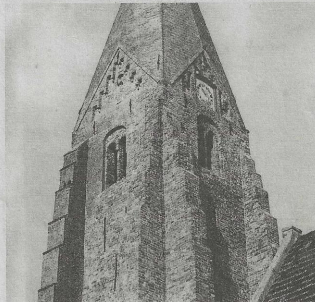
Detail van de stenen toren te Surhuizum met gemetselde spits.

Door Dirk R. Wildeboer te Buitenpost, secretaris van de Stichting Oud-Achtkarspelen.