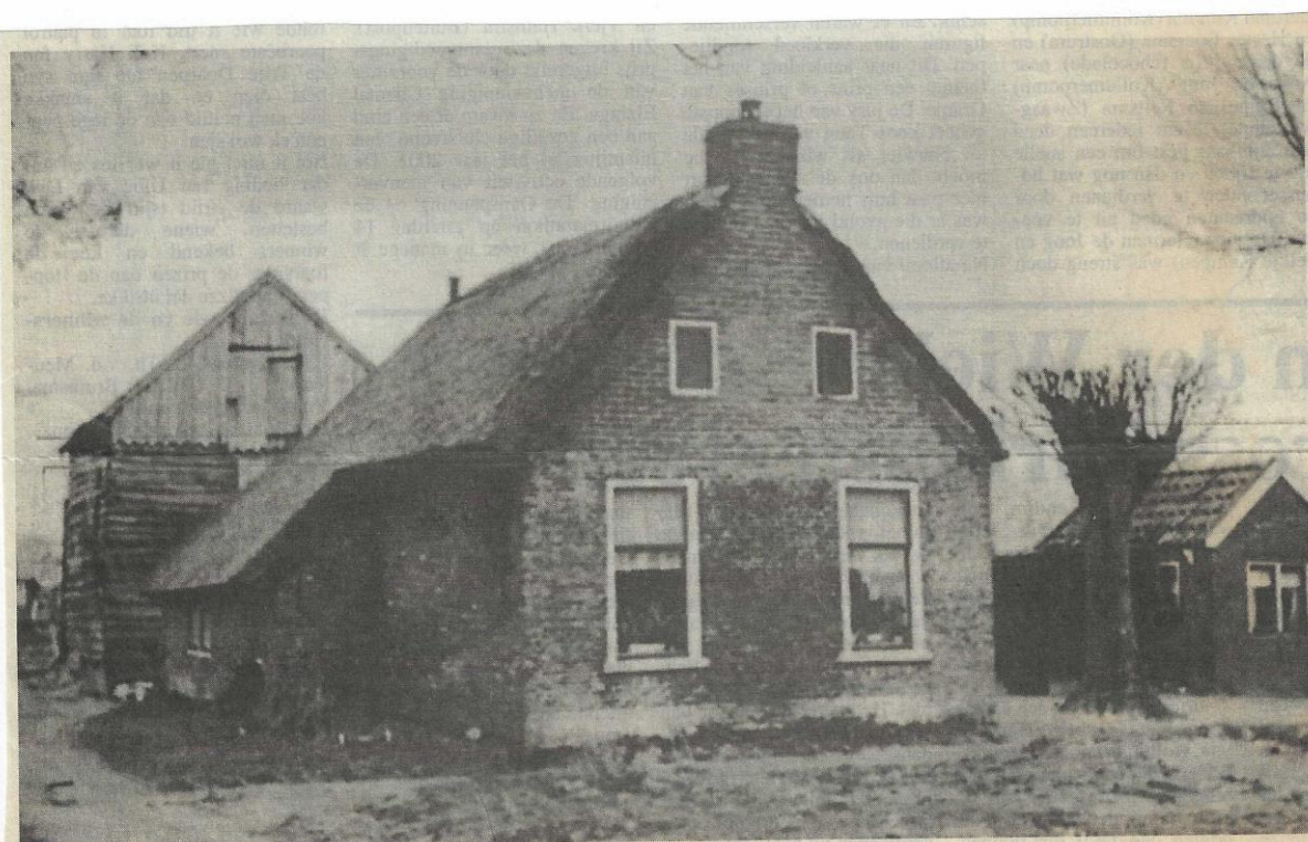
It Súd 46 te Surhuizum in 1965 (later afgebroken).