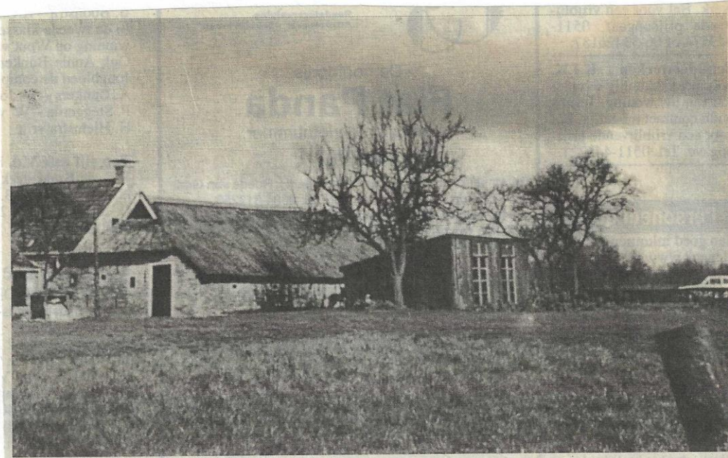
Koartwâld 7 te Surhuizum in 1965 (nadien afgebroken).